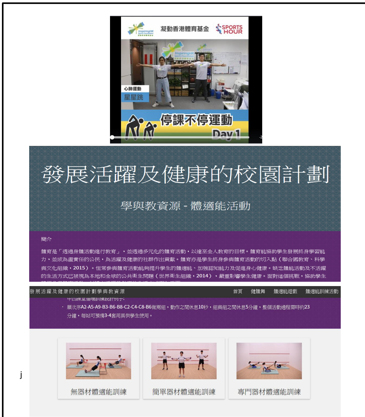
圖 1：體適能網上教學短片