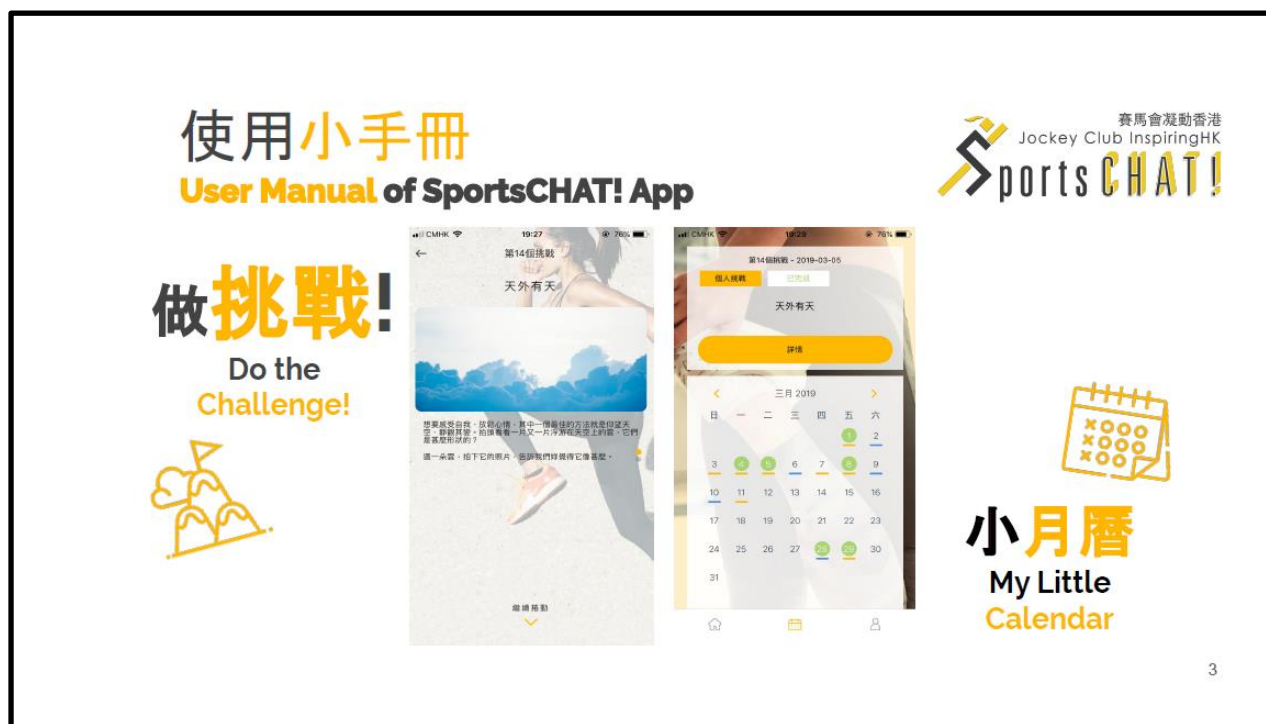
圖 2：凝動 SportsCHAT!計劃