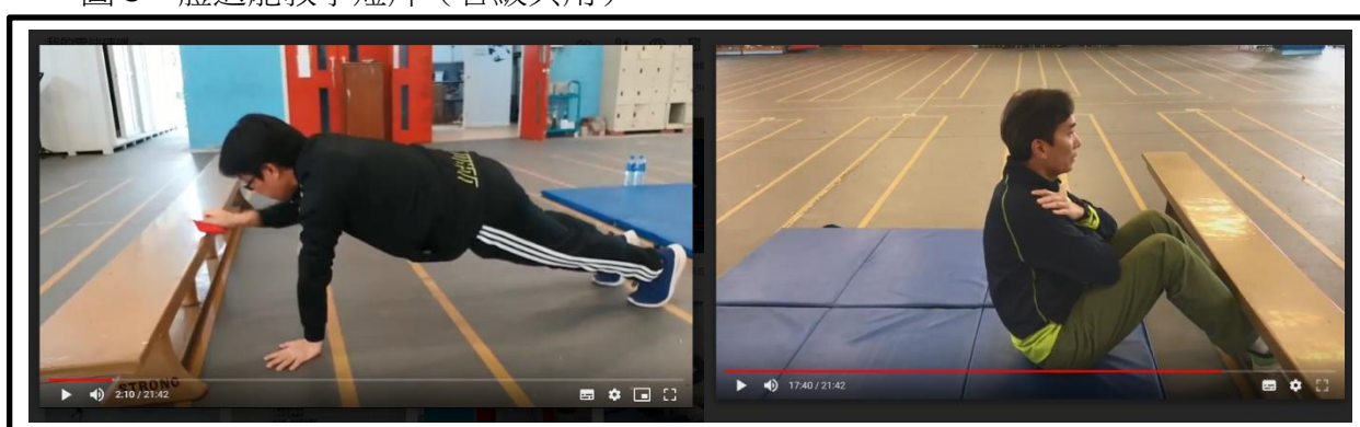
圖 3：體適能教學短片（各級共用）

校方提醒學生需要因應個別差異調整以上的體適能活動，例如初中同學可較少次數或時間，而高中同學則可增加；另外，校隊學生可進一步增加體適能活動的強度，例如增加循環訓練的循環次數，以協助學生保持適當的運動量。