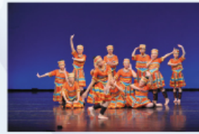
同學表現合拍，訓練有素。