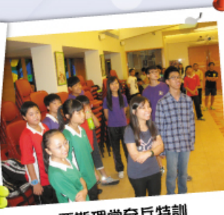
亞斯理堂奇兵特訓