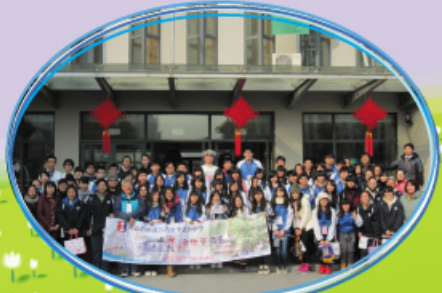
與上海閔行第三中學的師生大合照