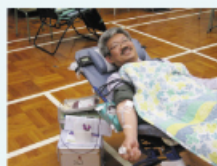
校長以身作則支持捐血日

捐血日已在1月初順利完成，本年度共有60多人參加，當中以中五班級的學生較為踴躍。除學生外，校長、老師們及部份家長教師會委員亦有參加捐血，在寒冷的冬天，身體力行幫助有需要的人士。