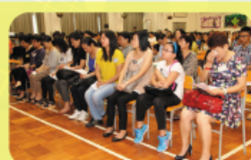
本校於暑假期間為中一學生推 行新生適應課程及中一家長日 ，家長表現投入。