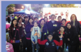
加點愛盆菜宴 「加點愛盆菜宴」在葵芳硬地 足球場舉行，筵開近百席，千 人參加。