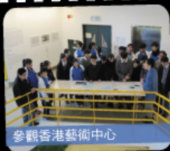
參觀香港藝術中心