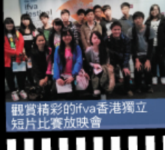
觀賞精彩的ifva香港獨立 短片比賽放映會