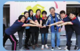
陸運會師生家長接力賽 比賽前大家都認真地練習，老 師家長互相打氣。