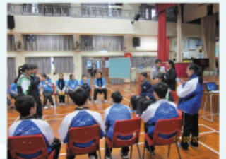
同學們透過不同活動掌握調解技巧

其次，輔導組於本年度3月4日星期二Day F邀請社會服務團體「森林聯盟」到校為中三級全級學生舉辦「性騷擾咪忍」性教育工作坊，藉此提高中三級學生對性教育的認知。當天活動以話劇形式進行，學生非常投入，氣氛相當熱烈，效果良好。