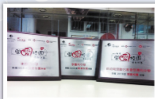
本校已連續多年獲發關愛校園獎項

熱烈恭賀本校獲基督教服務處頒發「關愛校園」獎項。本校已連續多年獲發此獎項，並將於5月領獎。