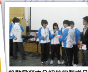
於啟發營中介绍信仰製成品