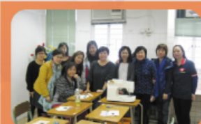
家長學院 鎖匙包製作班活動 加強了家長間的溝通，彼此交 換一下教子心得。