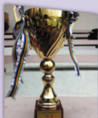
本校同學獲得回歸及國慶盃七人足球賽（中學組）冠軍