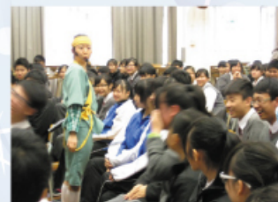
話劇演員走入同學當中，大家打成一片。

另外，訓導組抱著「人人可教」的信念和對品格教育的堅持，確立了學生訓育工作的長遠理念和目的。除了多元智能躍進計劃之外，「更生先鋒計劃」也是訓導組在學生品格培育計劃中重點項目。「更生先鋒計劃」——通過一系列教育及參觀活動，向青少年宣揚防止犯罪、吸毒的禍害和助更生的信息。訓導組與不同院校和社會服務機構緊密合作，向青少年灌輸正確的價值觀，令同學能自尊自重、自律自強、奮進，繼而培養良好品格，成為一位好學生及日後有責任感及奉公守法的公民。