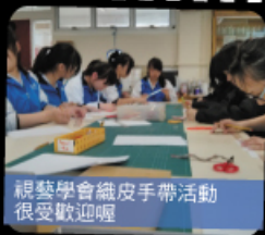
視藝學會織皮手帶活動 很受歡迎喔