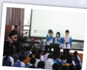
奇兵第一次帶詩歌

「To Learn! To Grow! To Serve!」。啟發奇兵們，加油！