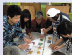
義工們與老人家一起玩遊戲，寓學習於娛樂。