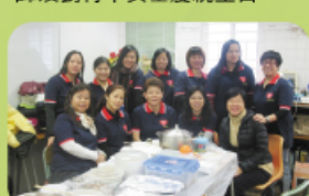
一班家長委員就像一家人，每 人各煮佳餚一款共賀生日。