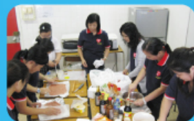
家長學院 豬肉乾製作班 家長們專心致志地炮製豬肉乾