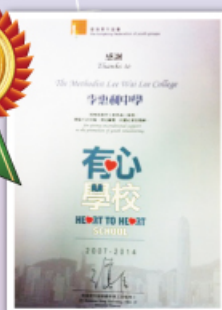
本校已連續多年獲頒有心學校獎項