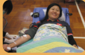
捐血日 家長支持捐血活動