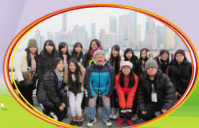
參觀上海陸家嘴金融中心