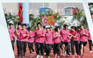
6A班同學於畢業長跑中奮力朝目標邁進