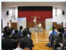
同學們聚精會神欣賞表演