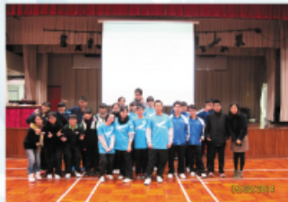
參與同學與本校社工進行大合照，以紀念這一次難得的交流機會。