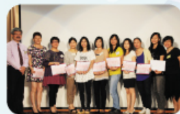
第十三屆家長教師會委員