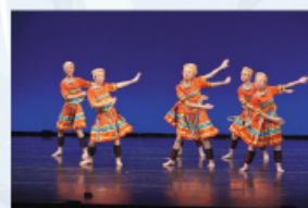
同學舞姿優美，令人留下深刻印象。

苗林山寨，一片美麗誘人的風光，一群少女身穿漂亮服飾，來到廣場上歡歌起舞——本校舞蹈組以舞蹈「苗歌」在2013—2014年度第50屆學校舞蹈節比賽及第27屆葵青區舞蹈比賽分別獲得銅獎及乙級獎。