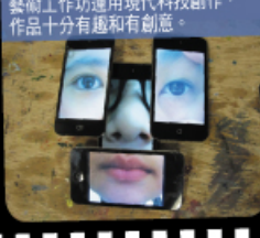
藝術工作坊運用現代科技創作， 作品十分有趣和有創意。