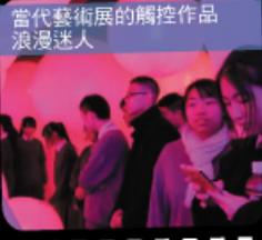
當代藝術展的觸控作品 浪漫迷人