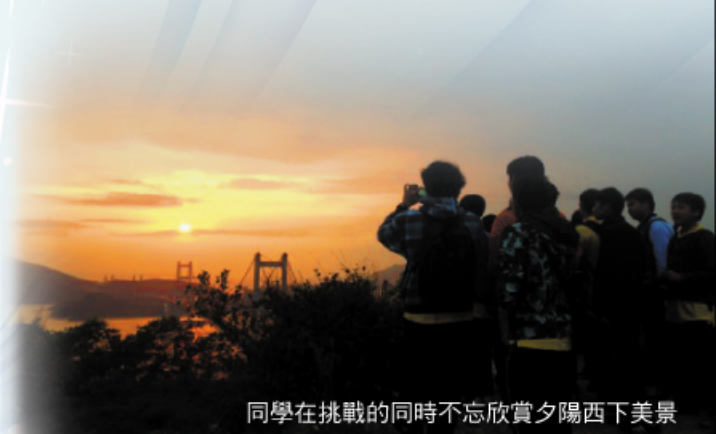
同學在挑戰的同時不忘欣賞夕陽西下美景