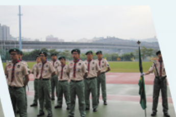
注重紀律的童軍為開幕儀式增添一份莊嚴感