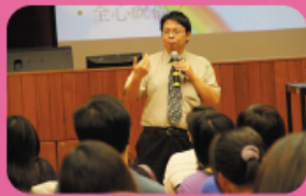
家長晚會講者向家長講解如何 指導子女交友