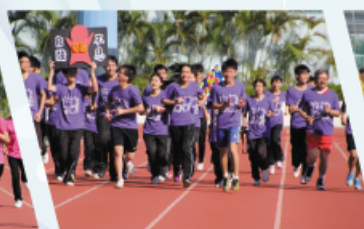
校長亦下場為畢業班同學打打气