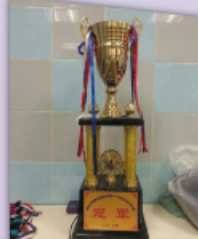
本校同學獲得彩虹盃七人足球賽冠軍