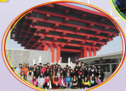
攝於上海世博會會址