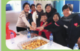
開放日 家長支持學校，為開放日送上 美食。