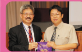
家長晚會 校長與家長晚會講者合照