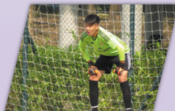
負責守龍門的同學嚴陣以待