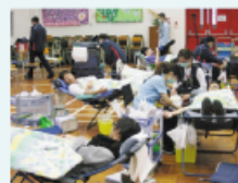
同學踴躍參與捐血活動