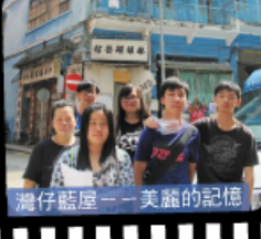
灣仔藍屋——美麗的記憶