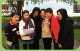
開放日中家長教師們合唱一曲