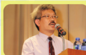
中一家長日 本校於暑假期間為中一學生推 於中一家長日，校長向各家長 解釋學校辦學方向。