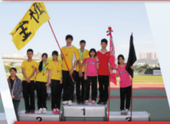
金楓社與紅棉社一起奪獎，友誼第一。