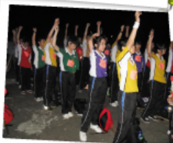
挑戰營中的夜行活動