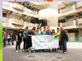
校長專程到屯門為同學打氣