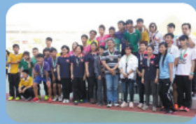
陸運會中一項別開生面的接力 賽，就是「師生家長接力賽」。 開跑後大家全力以赴，不論 哪隊勝出，友誼第一，充滿了 體育精神。