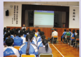
「更生先鋒計劃」教育講座