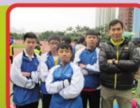
本校丙組同學積極參與不同比賽