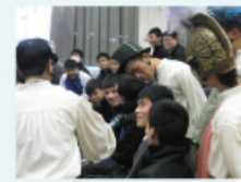
演員著重和同學的互動以加深其印象