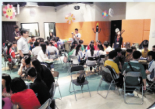
同學正聚精會神參與訓練課程

輔導組於今年挑選了11位中三及中四級同學參與了由教育局舉辦的「和諧校園」之「和諧大使朋輩調解」計劃，一方面鞏固及強化校園和諧氣氛，另一方面透過工作坊等訓練，以培養及提昇有潛質學生的解難能力與建立服務社群的內在意識。成為學生輔導員，讓他們學習服務精神，並透過參與服務，肯定自我能力及價值，加深學生的自我了解。亦藉著參與計劃，照顧低年級同學，促進同學間的友誼，實踐同學間守望相助，互助互愛的精神。有關的同學除接受了一次相關的訓練課程及參與多次調解技巧重溫工作坊外，亦曾與多間友校的同學就朋輩調解技巧作經驗交流。