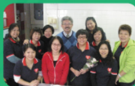
家長學院 糯米糍製作班 家教會舉辦了家長學院糯米糍製作班