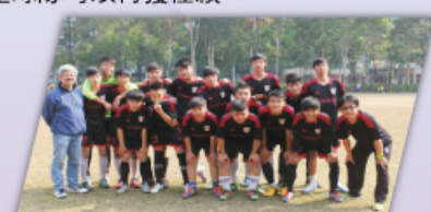
足球隊同學東征西討，屢創佳績，校長亦於百忙之中抽空到來支持。