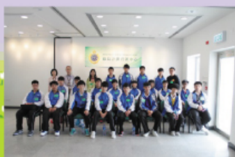
懲教署職員與本校師生合照

本校師生於2013年3月23日前往喜靈洲勵新戒毒所探訪，參觀毒品展覽館和環保設施，此活動向他們宣揚禁毒信息及保護環境的重要。此外，參與者亦會與戒毒所的青少年所員會面，了解吸毒的禍害。