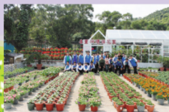
本校師生參觀喜靈洲環保花園