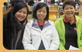
捐血救人，樂於助人。