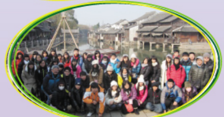
古色古香的水鄉——烏鎮