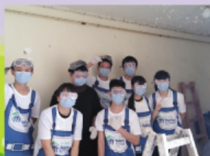
同學們整裝待發，一起為老人家締造較佳居住環境。