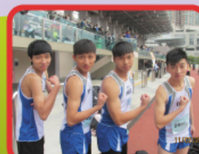
男同學們以強壯的手臂以示必勝的決心