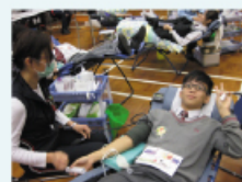
我的美好生日回憶