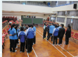
本校同學與友校同學進行交流，得益匪淺。