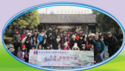
參觀西溪濕地，瞭解自然生態。