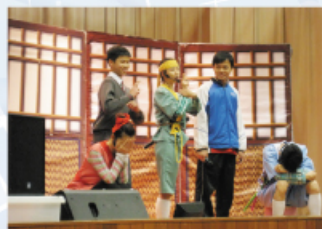
本校同學亦粉墨登場，參與其中。