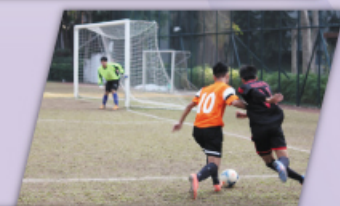
足球隊同學以汗水為校爭光