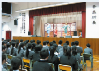
活動以話劇形式提高中三級學生對性教育的認知

其次，輔導組於本年度3月4日星期二Day F邀請社會服務團體「森林聯盟」到校為中三級全級學生舉辦「性騷擾咪忍」性教育工作坊，藉此提高中三級學生對性教育的認知。當天活動以話劇形式進行，學生非常投入，氣氛相當熱烈，效果良好。