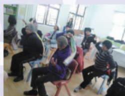
義工們與老人家一起做運動

本校社會服務團在去年10月份參加了由仁人家園舉辦的「綠色樂居無障礙」計劃，協助在公屋單位居住的長者，提供基本家居室內維修及改善服務。今次一共有10位同學參與義工工作，並分為兩組，協助兩名長者維修家居牆身及天花板。