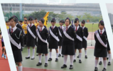
本校基督女少年軍英姿颯颯