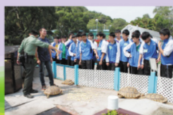
懲教署職員向同學講解所養動物習性，大家聽得津津有味。