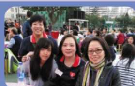
當天節目除了抽獎，還有美味 的盆菜，令人回味無窮。