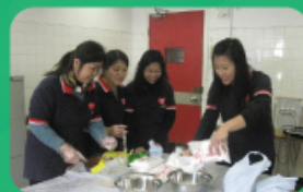
家長們學習製作糯米糍，送給 親友一份愛意。