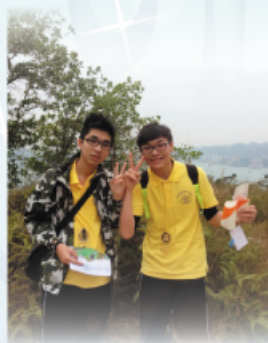
大家在過程中一絲不苟，希望能成功完成訓練。