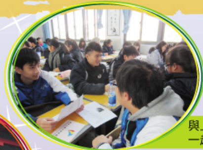
與上海閔行三中的同學 一起上課及進行小組討論