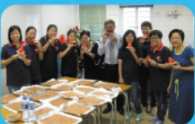
校長親自挑選了一個又大又甜 又多汁的西瓜給各位家長品嚐