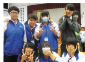
參與啟發課程的奇兵