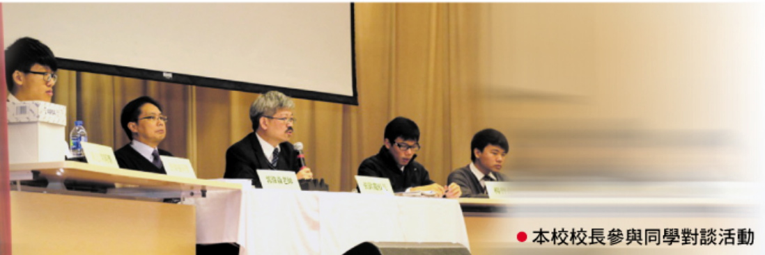
● 本校校長參與同學對談活動

電話：24279121 傳真：24245157 電郵：info@lwlc.edu.hk 地址：香港新界葵涌葵盛圍葵葉街2-4號