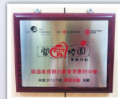
本校在校園當眼處掛上關愛校園獎項，以表揚師生們的努力。