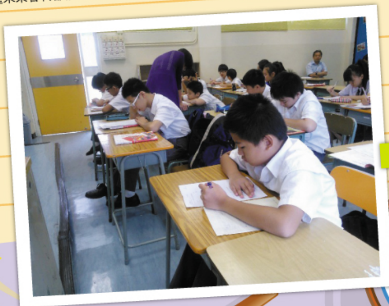
學生正專心上數學課

未來，我們將汲取有關經驗，更努力改善及推動課程改革，為學生提供更多教學資源及更優質的教學，盼望未來各科都能爭取更美好的成績。