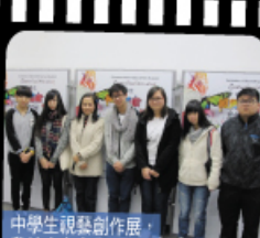
中學生視藝創作展 我校也有參與。