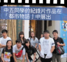
中五同學的紀錄片作品在 「都市物語」中展出