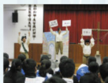
劇場演員以精湛的演技讓學生明白貪污的禍害

為培養學生的良好品德，公民教育組邀請中英劇團到學校演出廉政互動劇「威尼斯衰人」，以輕鬆的方法，讓學生明白貪污的禍害，增加他們對「防止賄賂條例」的認識，並教導他們舉報貪污的途徑。