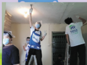
同學們不怕艱辛，只為付出自己的一點力，幫助有需要的老人家。